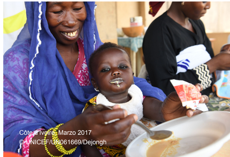
Côte d'Ivoire, Marzo 2017

Las transferencias monetarias no cambian la manera en la que los profesionales de la nutrición definen objetivos y seleccionan opciones de respuesta en materia de nutrición (por ejemplo, el tratamiento mediante la gestión comunitaria de la malnutrición aguda, la alimentación de lactantes y niños pequeños, la alimentación suplementaria, los suplementos de micronutrientes, etc.) a fin de abordar necesidades nutricionales identificadas 8 . El análisis de las opciones de respuesta puede ayudar a definir el momento oportuno de la posible respuesta, así como las opciones disponibles para atender las distintas necesidades nutricionales que coinciden en un contexto determinado. Las transferencias monetarias añaden modalidades adicionales para poner en práctica estas opciones de respuesta. En contextos en los que las comunidades se enfrentan a obstáculos económicos que les impiden subsanar los determinantes subyacentes de la malnutrición, las modalidades y los enfoques viables de transferencias monetarias se deben contemplar como parte del análisis de las opciones de respuesta. Seguidamente se muestran los cinco enfoques 9 principales del uso de las transferencias monetarias en la respuesta en materia de nutrición: