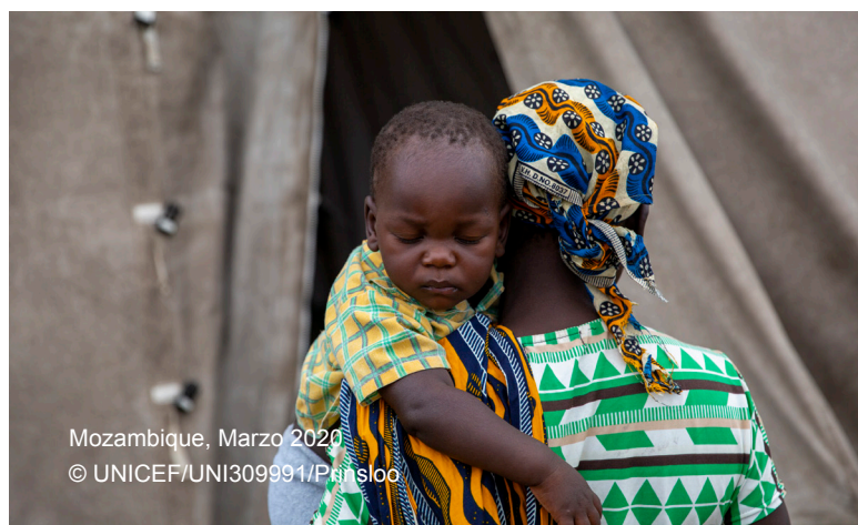
Mozambique, Marzo 2020

Al considerar un componente de las transferencias monetarias como parte de una respuesta en materia de nutrición, se deben identificar todos los riesgos pertinentes y se deben aplicar las medidas necesarias para mitigarlos. La mayoría de los riesgos asociados con las transferencias monetarias pueden ser mitigados durante el diseño del proyecto y mediante un sólido marco de rendición de cuentas. La Herramienta de análisis de riesgos y beneficios en materia de protección describe las consideraciones clave que los profesionales deben examinar para poder identificar los riesgos y beneficios en materia de protección de una intervención determinada. El documento Cash & Voucher Assistance and GBV Compendium –un compendio sobre transferencias monetarias y la lucha contra violencia de género– explica cómo incorporar la mitigación de riesgos relacionados con la violencia de género a las intervenciones en materia de transferencias monetarias, así como la manera de integrar su prevención en la programación multisectorial. Los riesgos detectados relacionados con las transferencias monetarias –tales como los riesgos relativos a la protección y la eficacia de las medidas de mitigación– deben ser monitoreados durante toda la respuesta.