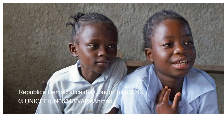
República Democrática del Congo, Julio 2019

Es necesario llevar un control del mercado a fin de contar con información actualizada sobre el valor de la transferencia con respecto a lo que esta permite adquirir. En contextos inestables, es posible que el monto de las transferencias deba ser ajustado en relación con los precios del mercado; de lo contrario, se corre el riesgo de comprometer el resultado nutricional previsto. En muchos contextos humanitarios, ya existen sistemas para evaluar y monitorear los mercados con respecto a los artículos alimentarios y no alimentarios. En consecuencia, el sector de la nutrición no siempre necesita recopilar información adicional relativa al mercado.