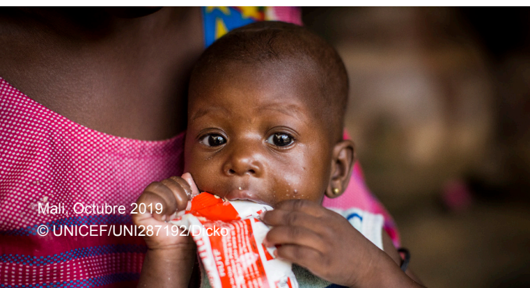
Mali, Octubre 2019

El seguimiento de la condicionidad puede ser una tarea compleja y costosa que requiere datos sustanciales, capacidad administrativa y humana, y coordinación en el plano interno y externo del programa 15 . Por lo tanto, es posible que la incorporación de la condicionidad sea más conveniente en situaciones prolongadas y menos pertinente en emergencias que surgen de manera repentina. Asimismo, una condicionidad “estricta” –según la cual los beneficiarios no reciben asistencia si no cumplen con dicha condicionidad– puede excluir a beneficiarios que no puedan llevar a cabo la actividad necesaria. La condicionidad “laxa” –menos severa respecto al cumplimiento de la condicionidad– ha demostrado ser una alternativa viable a la condicionidad “estricta” en diversos contextos humanitarios. Su principal ventaja es la posibilidad de reducir los costos administrativos y de seguimiento; asimismo, los beneficiarios no quedan excluidos de la asistencia si no logran cumplir las actividades que se exigen.